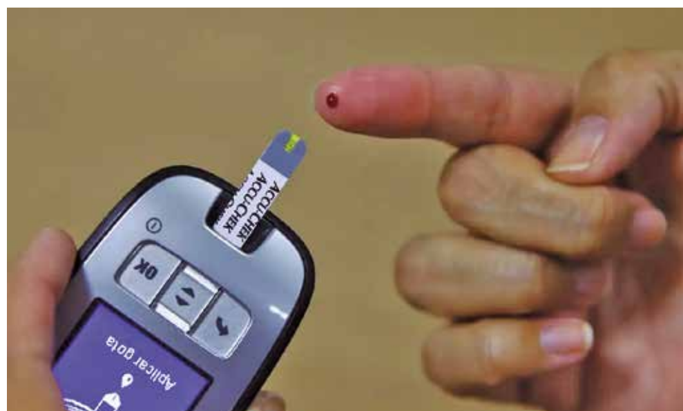
Entre os países membros da OCDE, uma em cada 10 pessoas tinha diabetes em 2023

• a melhoria nas taxas de sobrevivência, um inegável sucesso em saúde pública, significa que mais pessoas vivem por períodos mais lon-