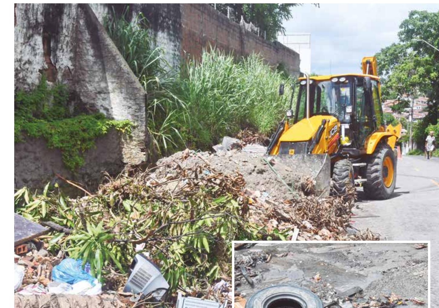
Lixo acumulado nas ruas — incluindo objetos como pneus, que acumulam água parada — é cenário ideal para reprodução do mosquito Aedes aegypti , vetor da dengue

Assim, a melhor forma de prevenir arboviroses segue sendo evitar a proliferação do mosquito, eliminando água armazenada sem necessidade, mantendo as caixas d’água bem fechadas, não jogando lixo nas ruas e contribuindo para o trabalho de limpeza urbana. “Essas ações ajudam a evitar possíveis criadouros do mosquito, que se reproduzem, especialmente, em pontos de água parada. Se combatermos a larva, evitamos o mosquito em idade adulta, quando ele é capaz