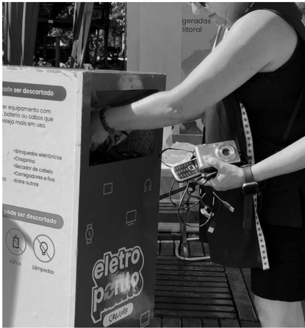
Itens poderão retornar ao ciclo produtivo, por meio de reciclagem, incentivando a economia