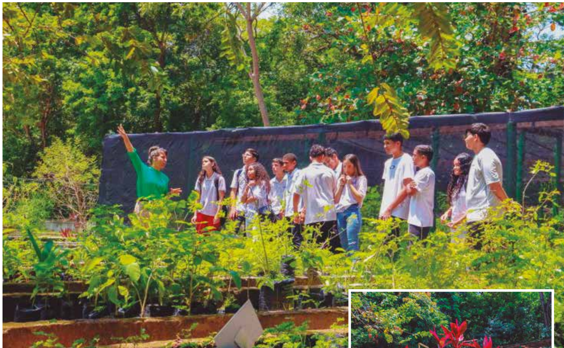
Aberta a todo o público, agenda de amanhã visa promover uma imersão no trabalho desenvolvido por pesquisadores da área; entre as atividades, haverá a distribuição de mudas

Além da exposição, também será oferecida uma oficina