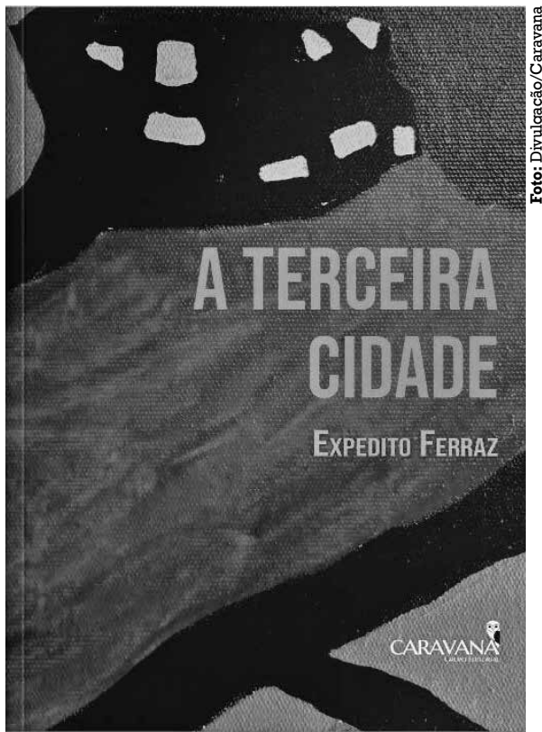
Capa de A terceira cidade , da autoria de Expedito Ferraz

Excelente a estreia de Expedito Ferraz no gênero romance.