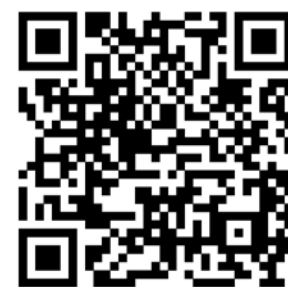
Pelo QR Code acesse a plataforma Meu INSS

O atendimento telefônico está disponível de segunda a sábado, das 7h às 22h.