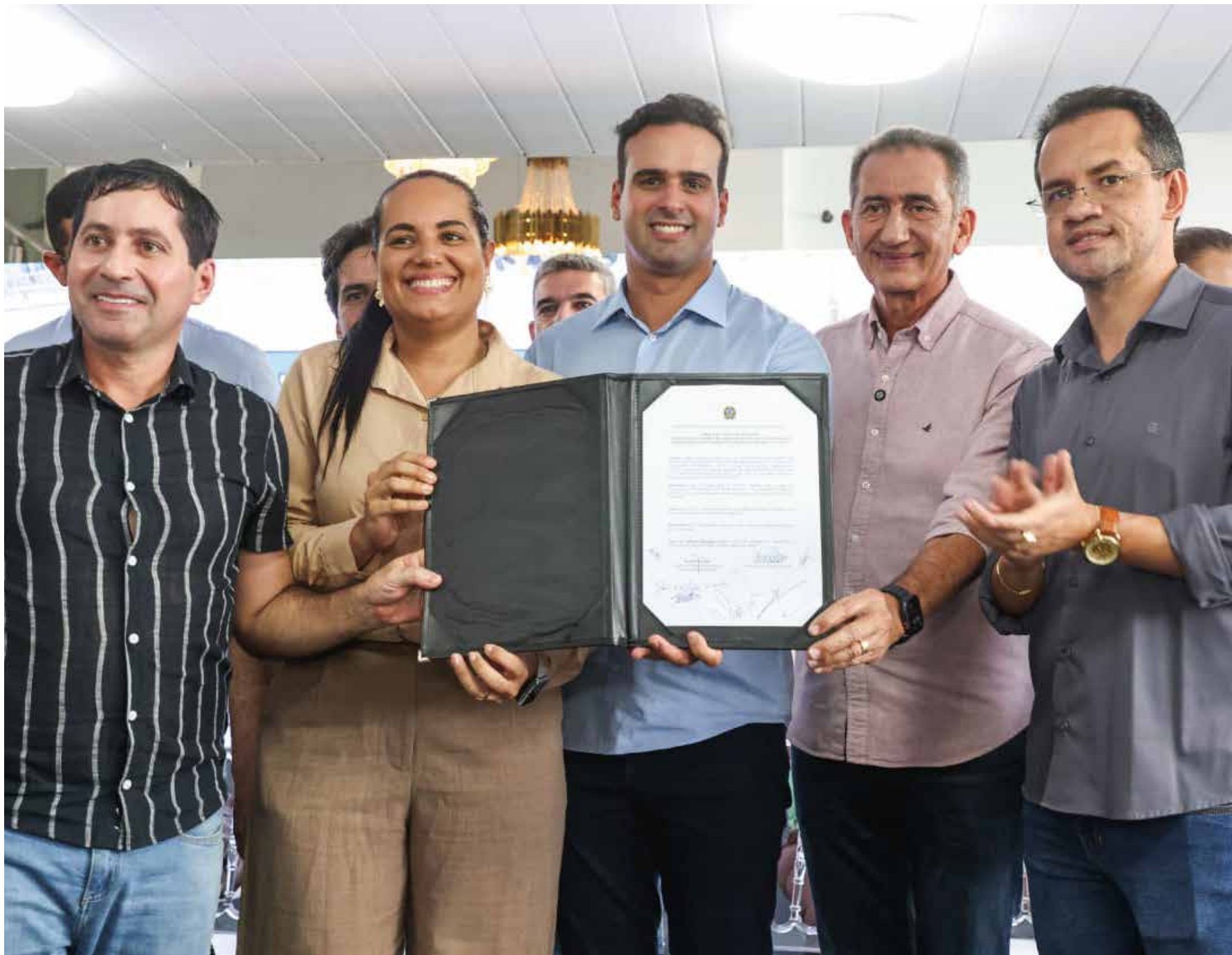
Governador Lucas Ribeiro e ministro Waldez Góes assinaram, ontem, a ordem de serviço, em solenidade realizada em Itapororoca