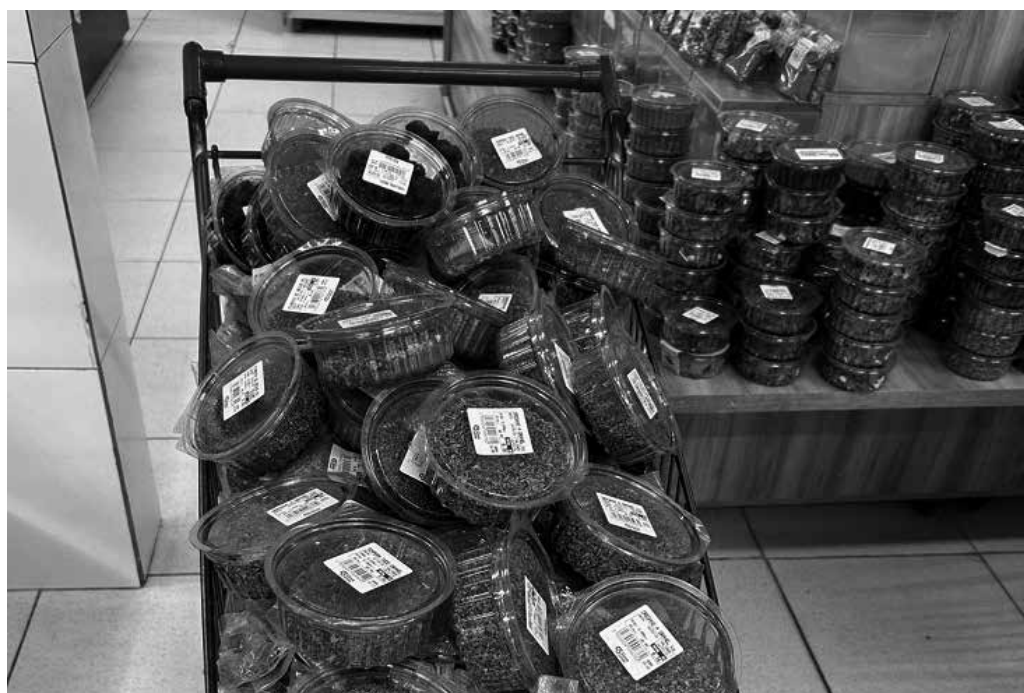
Produtos comercializados em supermercado apresentavam prazo de validade vencido

A empresa autuada, de acordo com as autoridades, terá o prazo de 10 dias úteis para apresentar defesa.