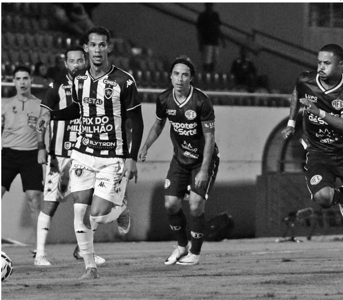
No último sábado (11), o Botafogo conquistou uma expressiva vitória sobre a Ferroviária-SP, por 2 a 0, pelo Brasileiro Série C