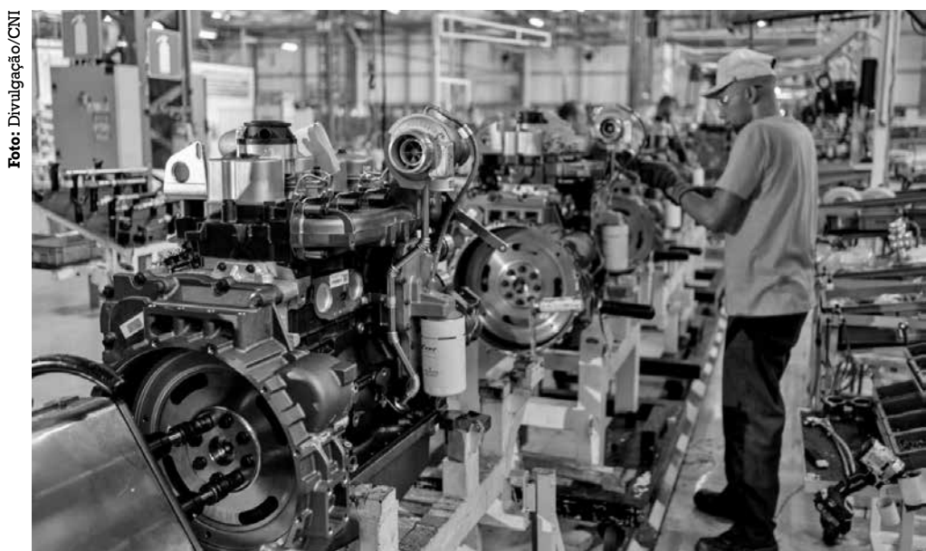
Pessimismo dos empresários aumentou pelo terceiro mês consecutivo, chegando a 45,2 pontos

■ Débitos em atraso de seis estados e municípios somavam mais de R$ 384 milhões