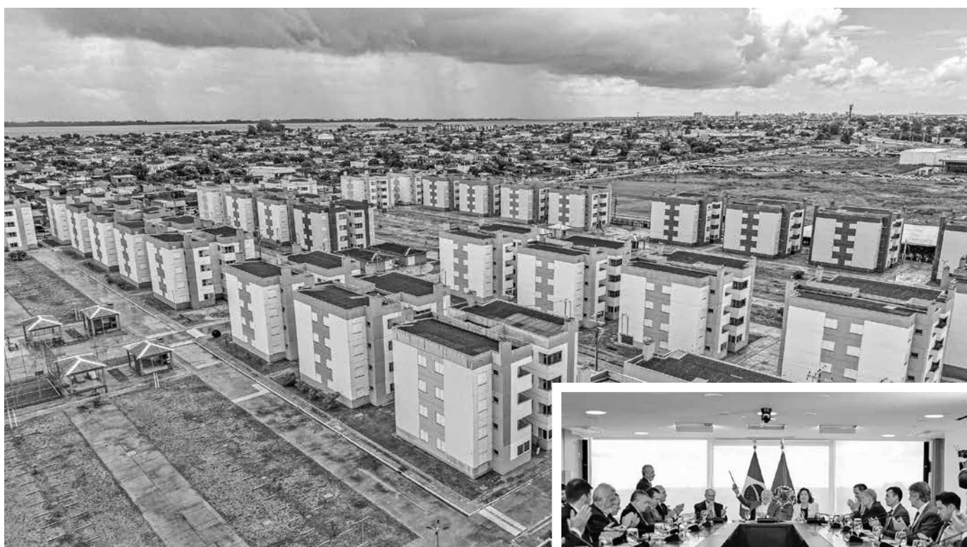
Meta é chegar a três milhões de contratos até o fim de 2026; o presidente Lula anunciou as novidades durante reunião com ministros e representantes do setor, no Palácio do Planalto

Durante a cerimônia, o Ministro das Cidades, Vladimir Lima, lembrou que o MCMV conta também com recursos do Orçamento Geral da União, além do FGTS.