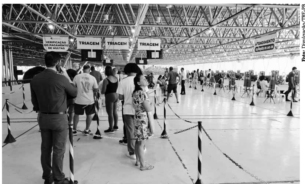
Na capital, a prestação do serviço está restrita ao posto instalado no Espaço Cultural

O eleitor deve apresentar documento oficial com foto original, além de comprovante de residência atualizado. O atendimento no térreo do Espaço Cultural é exclusi-